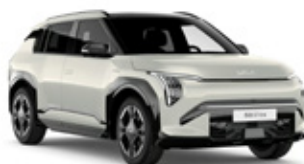
Ivory Silver Metallic