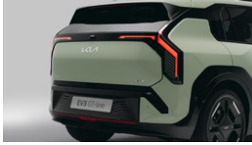
Rear Dynamic Light إضاءة خلفية ديناميكية