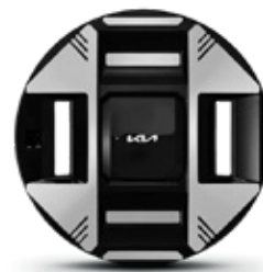
19 inch Alloy wheels