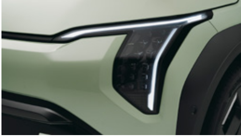
Full LED Small Cubic Head Lamp مصباح أمامي صغير مكعب الشكل مزود بإضاءة LED كاملة