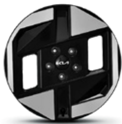
17 inch Alloy wheels