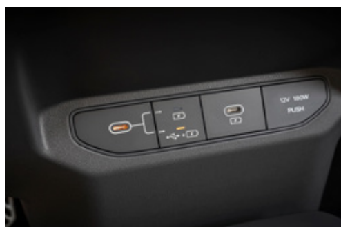
Type-C USB Charger شاحن USB من نوع C