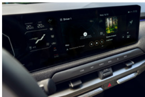
25 Inch Panorama Display شاشة بانورامية مقاس ٢٥ بوصة