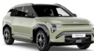
Aventurine Green Metallic