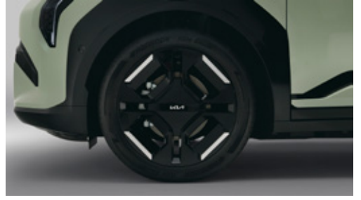
19 Inch GT-Line Wheel جنط مقاس ١٩ بوصة من فئة GT-Line