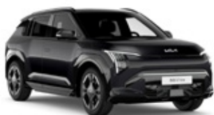
Aurora Black Metallic