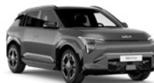
Slate Grey Metallic