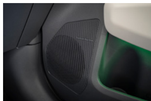
Harman Kardon Speakers سماعات هارمان كاردون