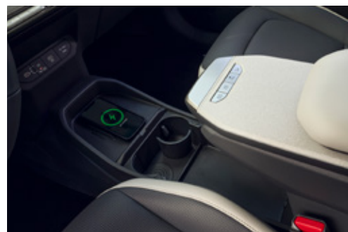
Sliding Console وحدة تحكم منزلقة