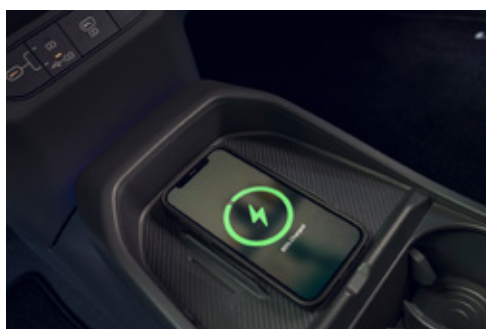
Wireless Charger شاحن لاسلكي