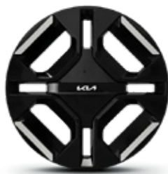
19 inch Alloy wheels (GT-Line exclusive)