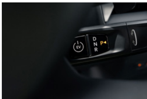
Shift By Wire - Column Type ناقل حركة إلكتروني - من نوع عمود التوجيه