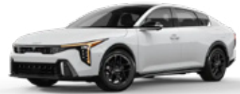
Snow White Pearl