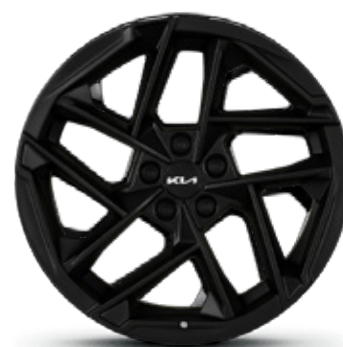
18" Alloy Wheel (GT-Line Black Edition)