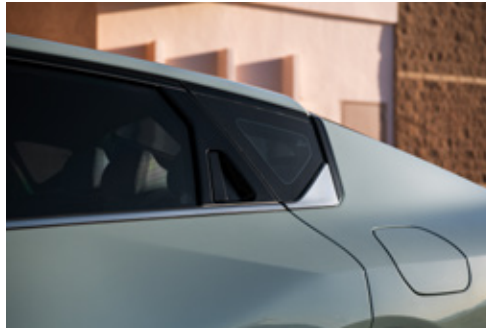
Vertical Rear Outside Door Handle مقبض خارجي عمودي للباب الخلفي