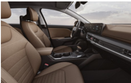
EX | Canyon Brown