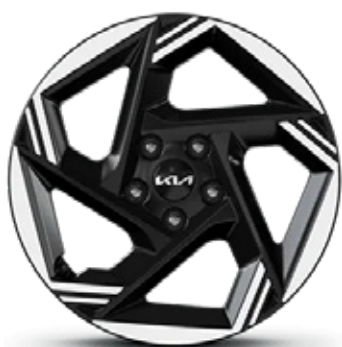
17" Alloy Wheel