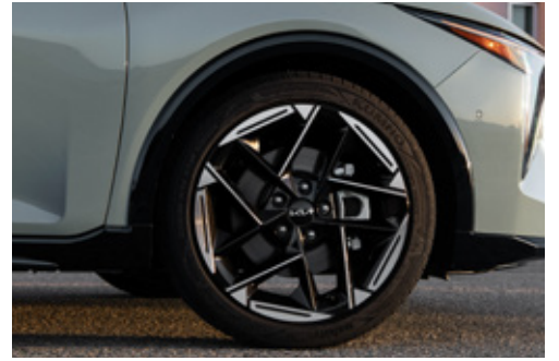
Two Tone 18" Alloy Wheel جنط ألومنيوم مقاس 18 بوصة بلونين