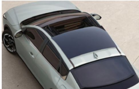
Wide out Sliding Sunroof فتحة سقف منزلقة عريضة