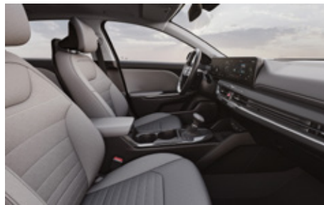
EX | Medium Gray