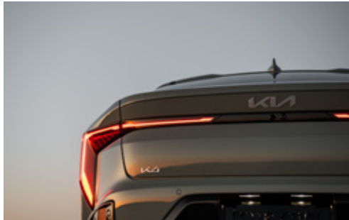
Rear Combination LED Lamps مصابيح LED خلفية