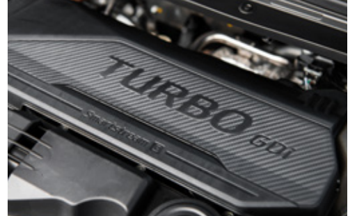
1.6 Turbo Engine with 190 HP محرك تيربو 1.6 لتر بقوة 190 حصاناً