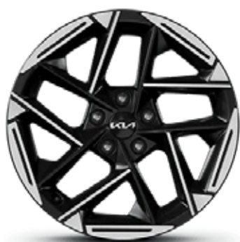
18" Alloy Wheel