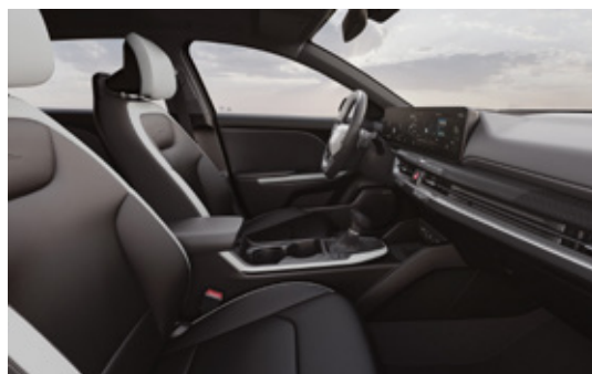
GT-line Black Edition | Onyx Black