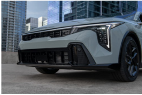
LED Lamps (Cubic Projection) مصابيح LED بإضاءة مجسّمة على هيئة مكعب